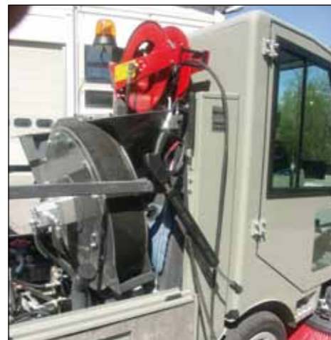
Idropulitrice (Di serie)