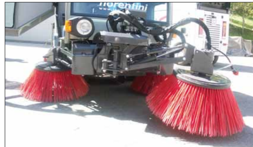
Terza Spazzola (Accessorio)