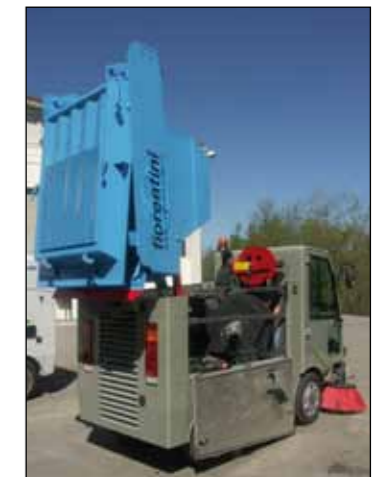
Accessibilità per Manutenzione