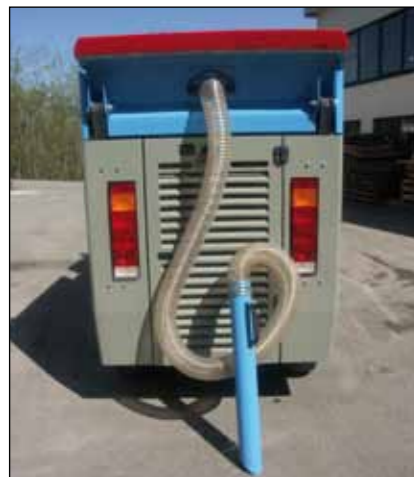
Tubo spirante (Accessorio)

La S150 possiede un sistema di ricircolo acqua e l'abbattitore polvere.